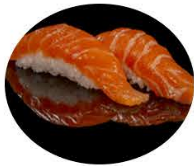
136.Salmón (2u) Nigiri salmón 4,95€