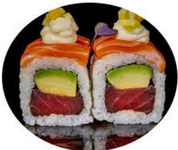
115.Mango fresh (8u) Ura atún,aguacate, salmón, mango y mayonesa japonesa, 10,50€