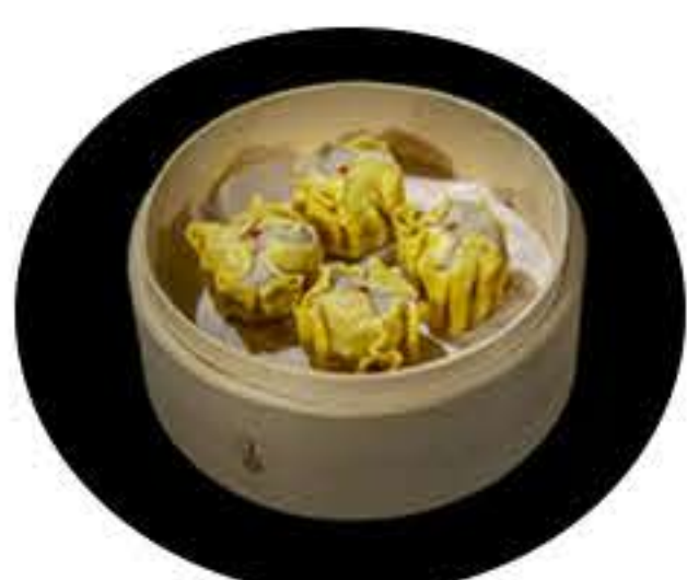
14. Shou mai (4u) 5,00€