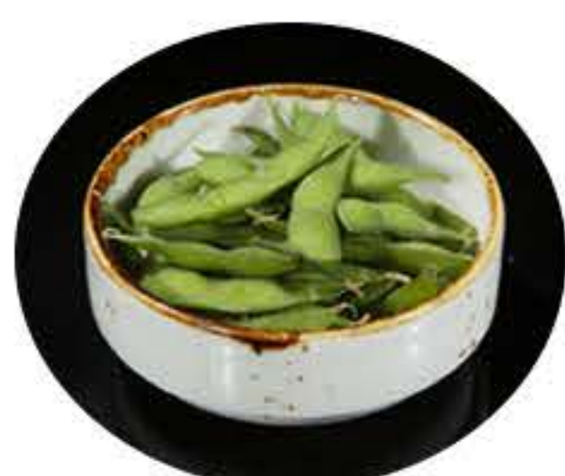
12. Edamame 5,00€