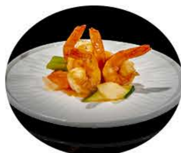
72. Gambas agri dulces 8,00€