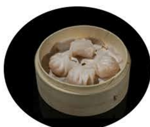
16. Gyoza de langostino (4u) 5,00€