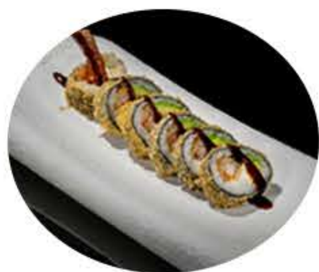
128.Tempura langostino (6u) Tempura de langostino, philadelphia, aguacate y salsa anguila 9,95€