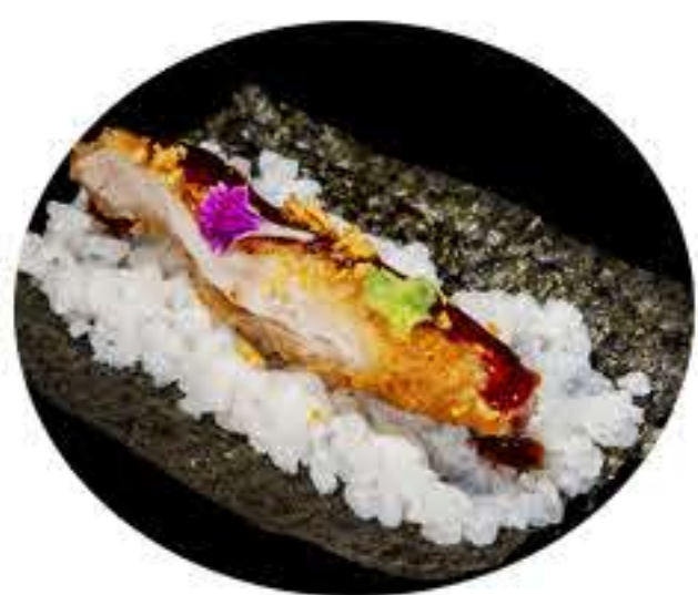
131.Pollo frito, pistacho y salsa anguila 5,50€