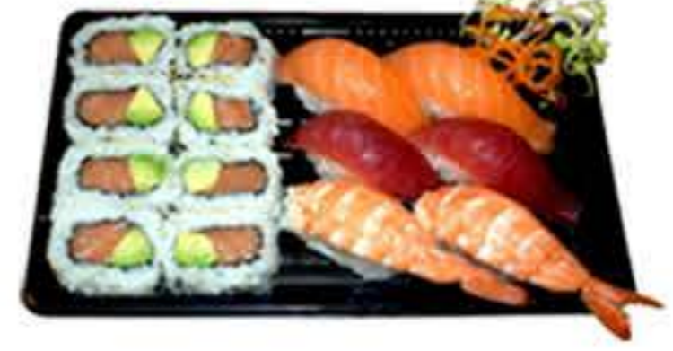
Bento 5 (14u.) 17,00€