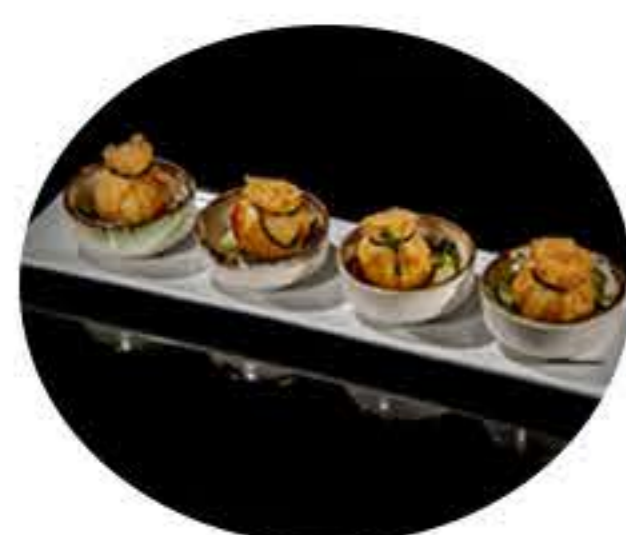
34.Atadito vegetal (6u) 4,50€