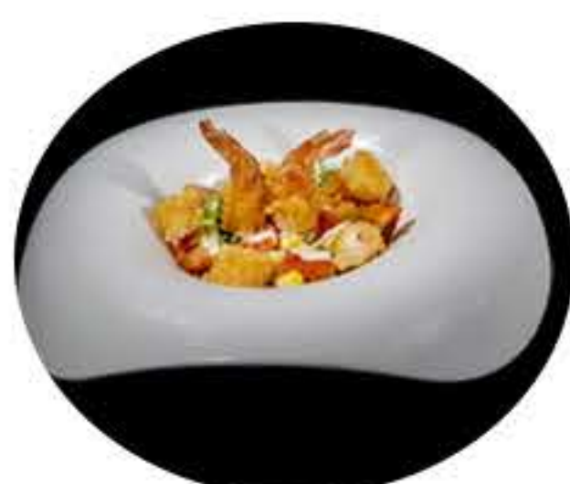
9. Ensalada de langostinos en tempura 6,95€