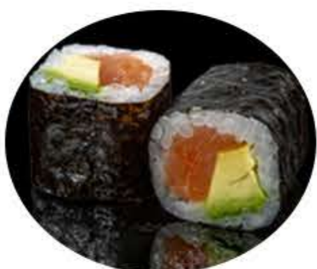
106. Maki de (8u) salmón aguacate 6,95€