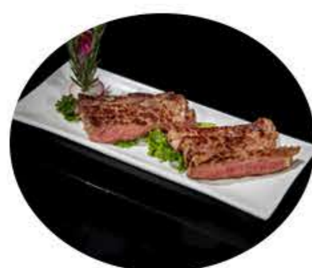
51.Entrecot a la plancha 8,95€