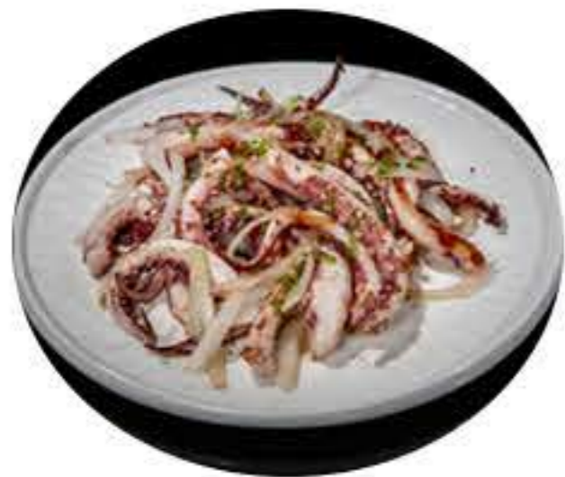
59. Rejos 7,50€