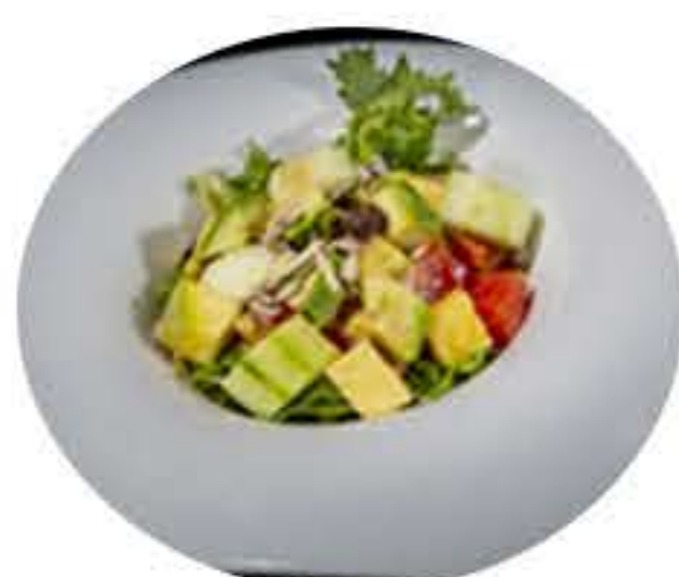
5. Ensalada de la casa 5,50€