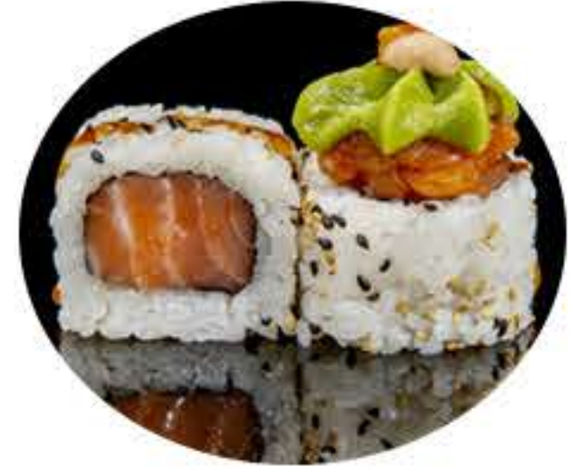
110.Salmón picante (8u) Ura salmón,aguacate, salmón picante, salsa teriyaki y mayonesa picante, 9,50€