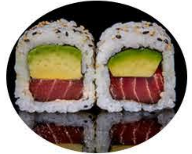
114.Atún aguacate (8u) Ura atun, aguacate 8,95€