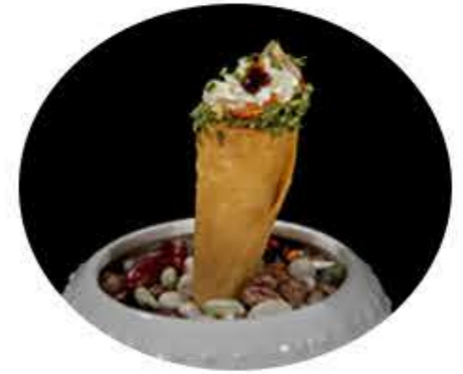
153. Cono salmón Cono hoja de arroz, salmón picante, philadelphia, perejil seco y salsa anguila 4,95€