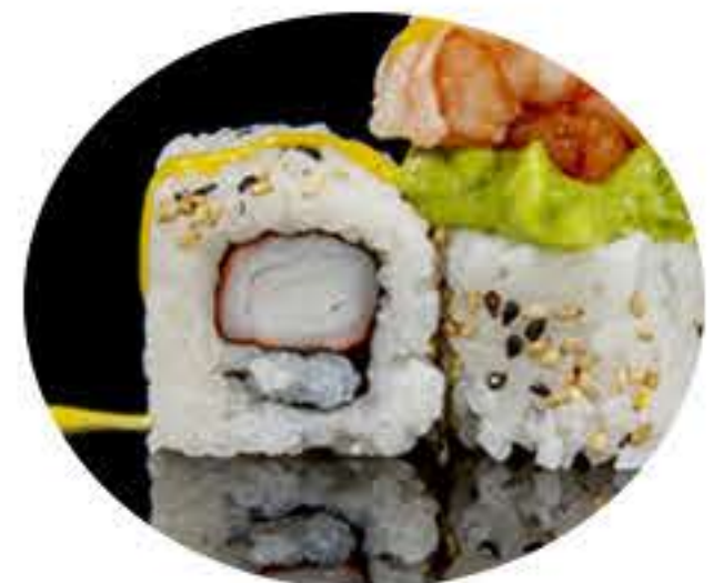
122.Surimi función (8u) Ura surimi,aguacate salmón picante, gambas,mango, pistacho y salsa de mango 10,95€