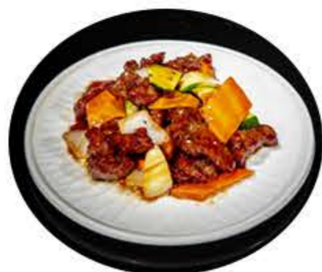
75. Ternera con teriyaki 7,95€