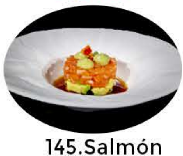
145.Salmón aguacate Tartar salmón, aguacate,salsa ponzu y salsa aguacate 10,95€