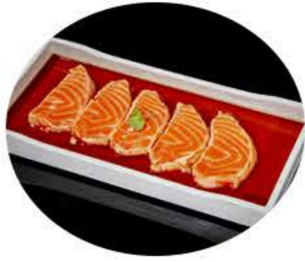
149. Carpaccio sashimi salmón flameado Sashimi salmón flameado y salsa especial 9,95€