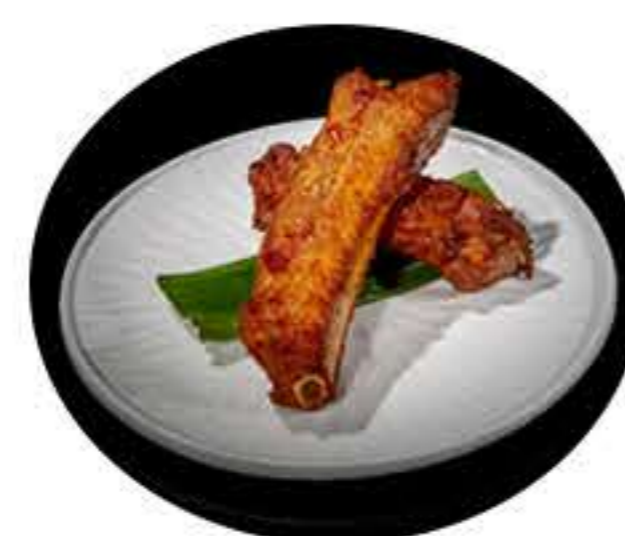
39.Costilla estilo japonés (3u) 6,00€