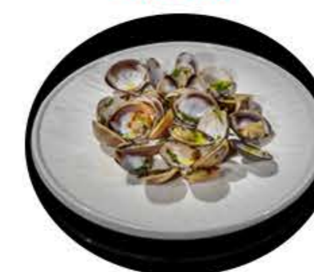
53.Almejas a la plancha 7,50€