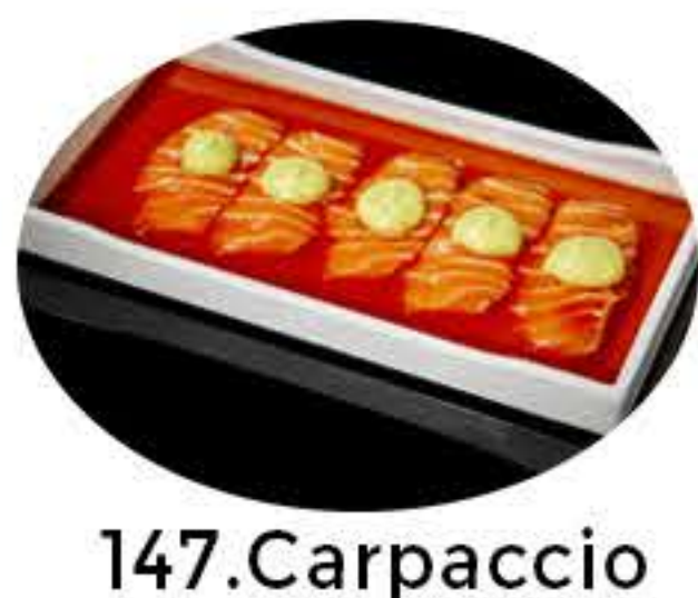
147.Carpaccio salmón Carpaccio de salmón,salsa aguacate y salsa ponzu 9,95€