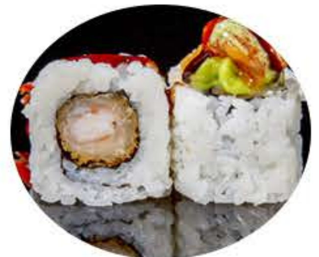
118.Flor (8u) Ura tempura de langostino,aguacate, salmón picante, mayonesa,salsa anguila y salsa rucula 10,50€