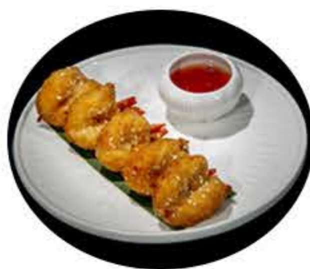
32.Langostino en kimono (5u) 5,00€