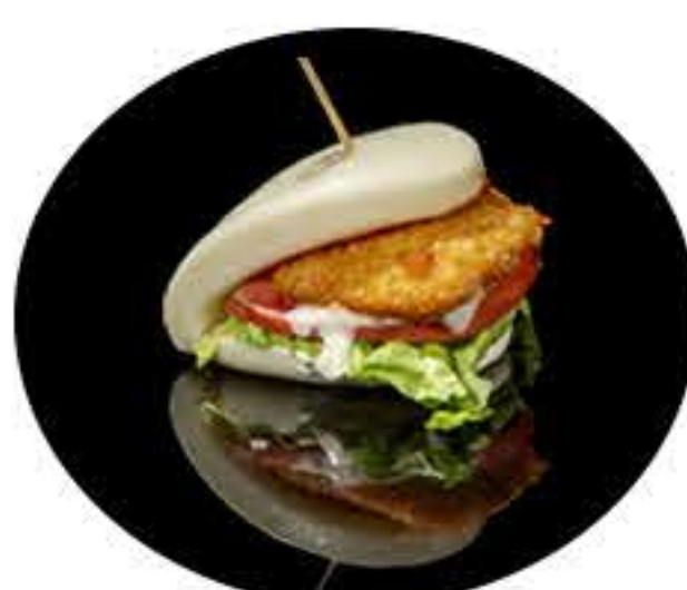
13. Pan bao de pollo (1u) 4,60€