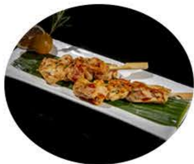
56. Pincho de pollo (3u) 7,00€