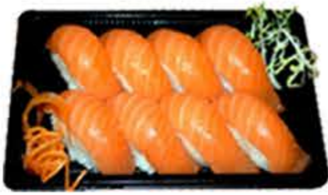
Bento 3 (8u.) 11,95€