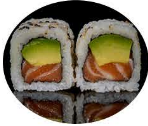
108.Salmón aguacate (8u) 7,95€