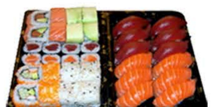
Bento 8 (36u.) 37,50€