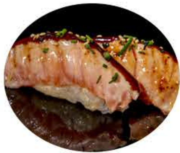
137.Salmón flameado (2u) Nigiri salmón flameado 4,95€