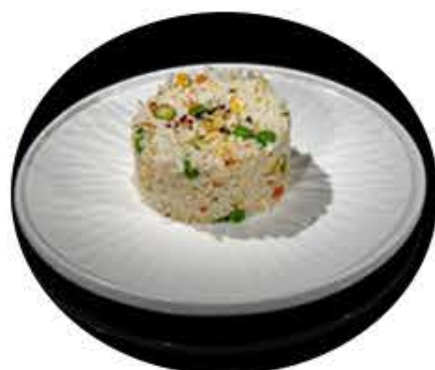
21. Arroz de la casa 5,95€