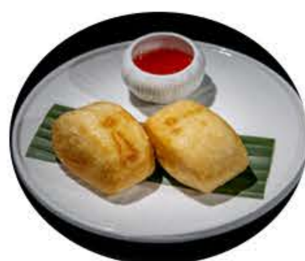
38.Pan frito (2u) 2,80€