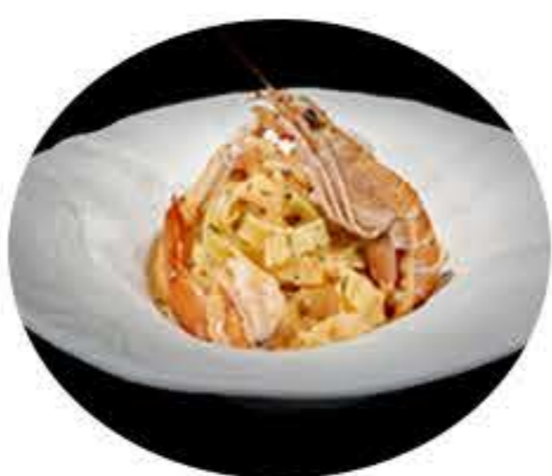
29.Tallarines con gambas i cigala 8,50€