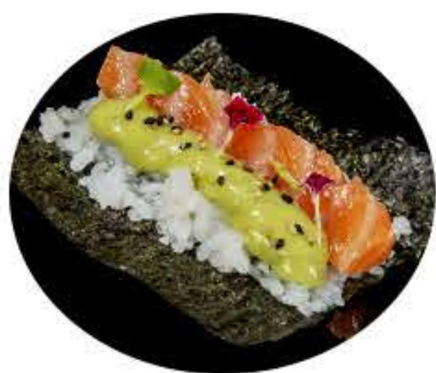
130.Salmón, sésamo y salsa aguacate 5,50€