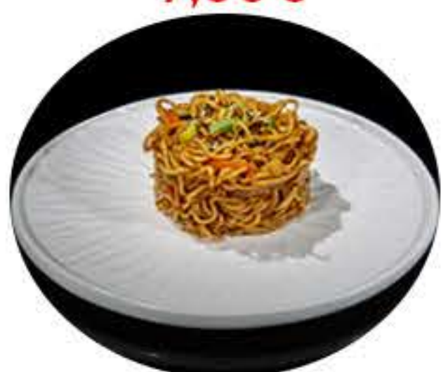
27. Yakisoba con verduras 7,50€