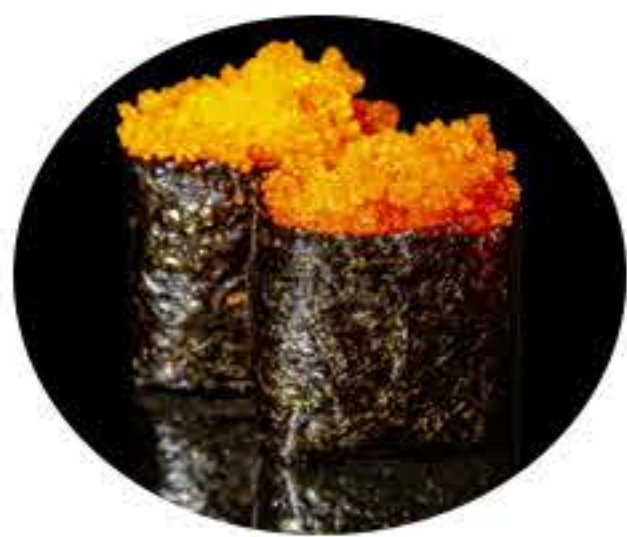
133.Tobiko naranja (2u) Gunkan tobiko naranja 4,50€