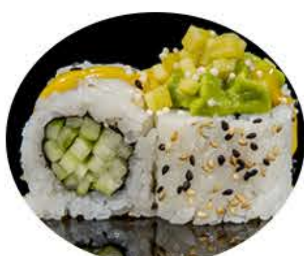
124.Green vegetal (8u) Ura pepino, aguacate,mango, Azuma arroz y salsa de mango 7,00€