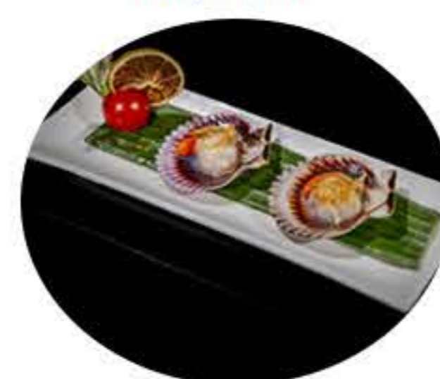
52.Vieiras a la plancha (4u) 7,95€