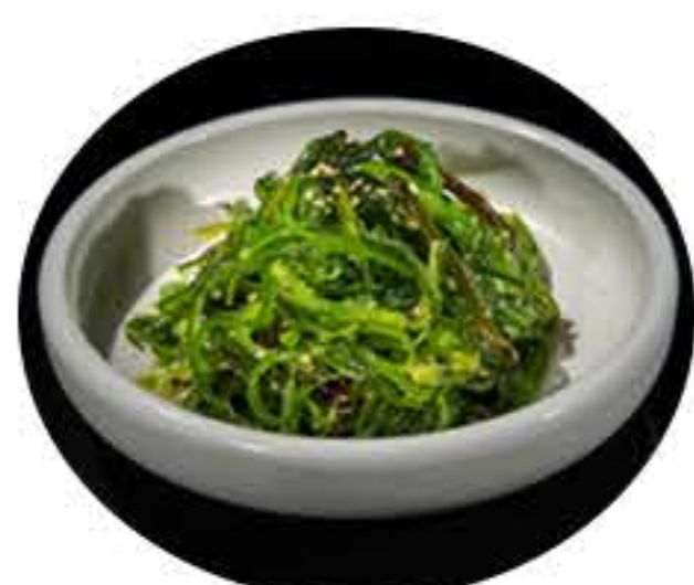
4. Wakame 4,50€