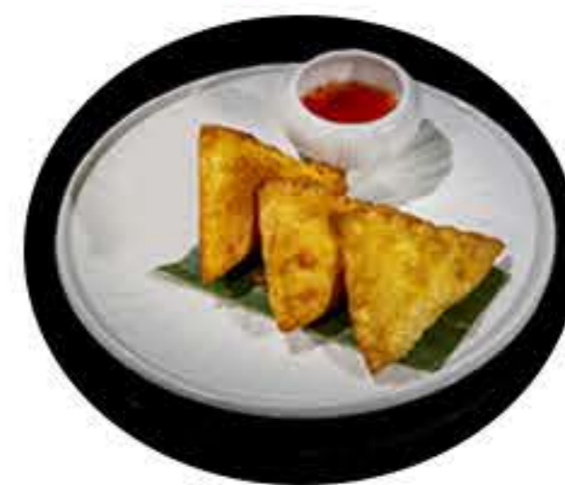
45.Samosas al curry (4u) (pollo y verduras) 5,00€