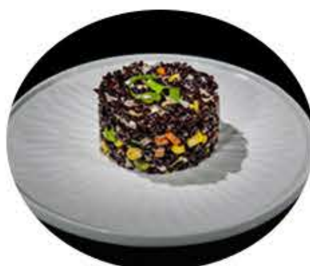
26. Arroz negro con verduras 6,95€