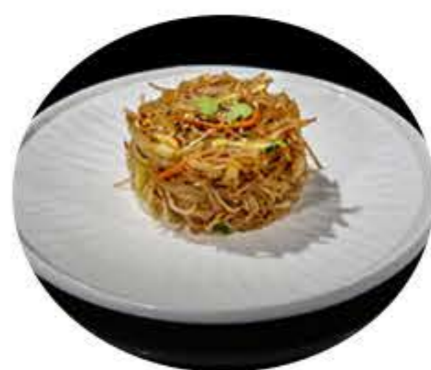
30.Fideos de arroz con verduras 7,50€