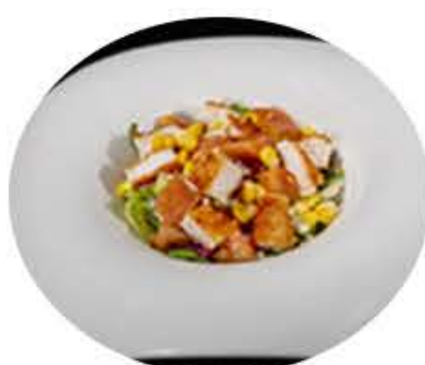
6. Ensalada deluxe cesar con pollo 6,50€