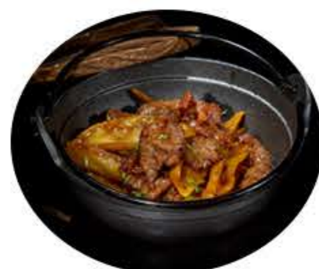
73. Ternera con patata y salsa pimienta 7,95€