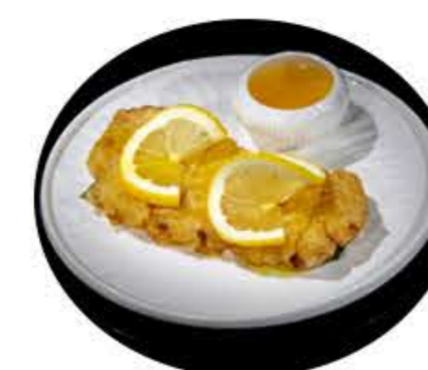
47.Pollo al limón 6,50€