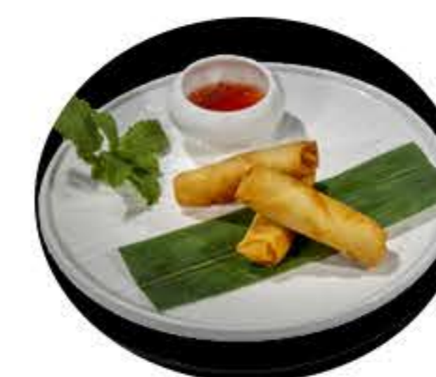
40.Harumaki vegetal (6u) 5,00€