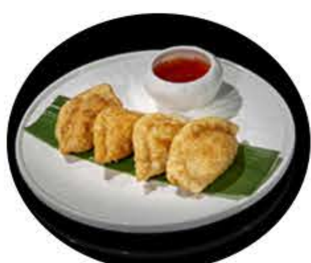
18. Gyoza frita (5u) (carne y verduras) 5,00€