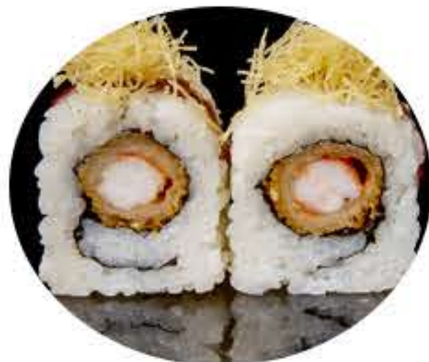
117.Ebiten (8u) Ura tempura de langostino, kataifi,mayonesa y salsa anguila 8,95€