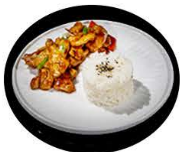
23. Pollo con salsa pimienta i arroz blanco 7,50€