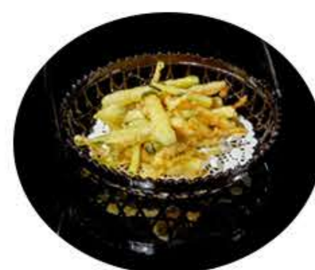
41.Tempura de verduras 5,00€