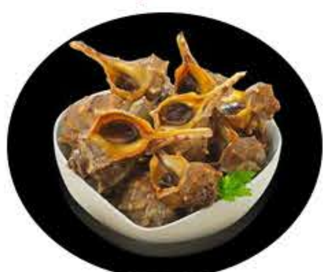
11. Cañailas 7,50€