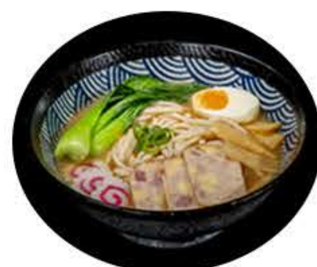
3. Ramen 7,50€