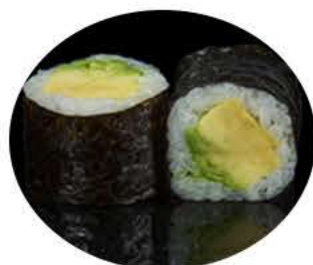
107. Maki de aguacate (8u) 5,50€