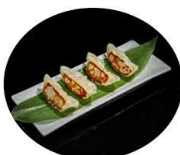
17. Gyoza a la plancha (5u) (carne y verduras) 5,00€