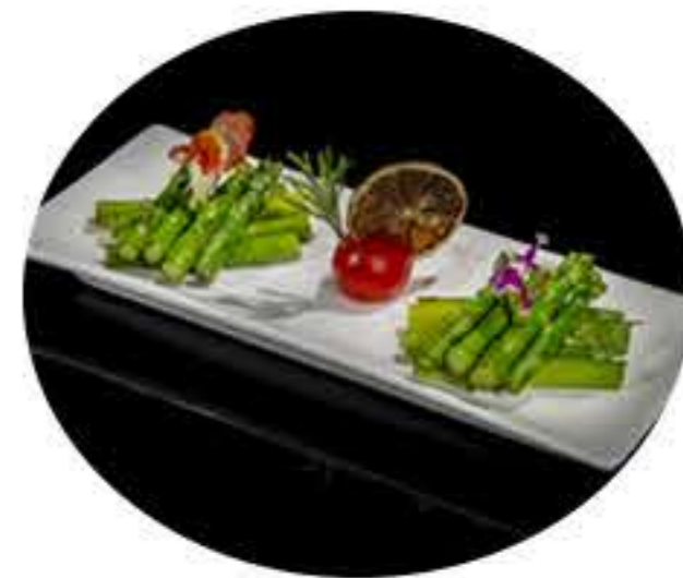
62. Espárragos 6,50€