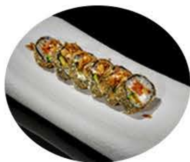
129.Tempura salmón (6u) Tempura de salmón, philadelphia,aguacate, cebolla crujiente, mayonesa japonesa y salsa teriyaki 9,95€