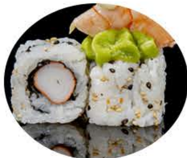
121.Clásica (8u) Ura surimi,aguacate gambas,tobiko y mayonesa japonesa 9,95€