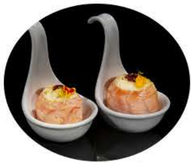
134.Salmón flameado (2u) Gunkan pure de patata,salmón flameado pistacho,mayonesa especial y salsa anguila 5,50€