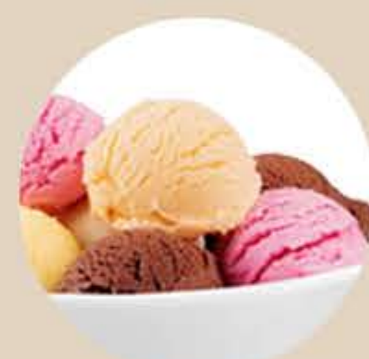
312.Helado Fresa, limón, chocolate, vainilla o té verde 5,35€ (3 bolas) 1,95€ (1 bola)