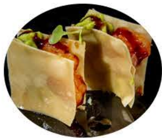
135.Crujiente salmón (2u) Crujiente hoja de arroz,salmón picante, philadelphia, aguacate y salsa anguila 4,50€