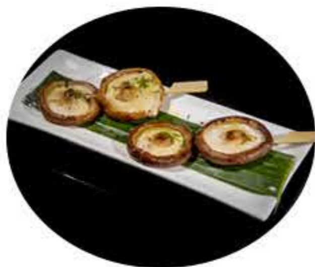
57. Pincho de setas (3u) 7,00€