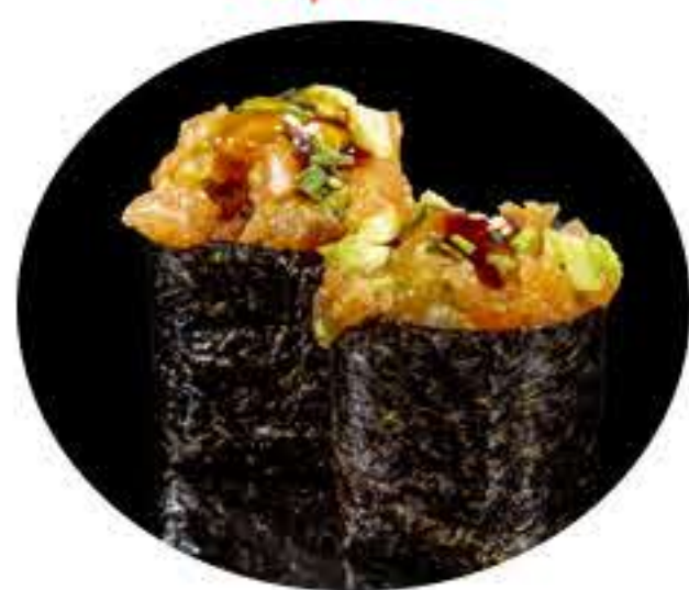
132.Salmón (2u) Gunkan salmón, aguacate,sésamo, salsa picante y salsa teriyaki 4,95€