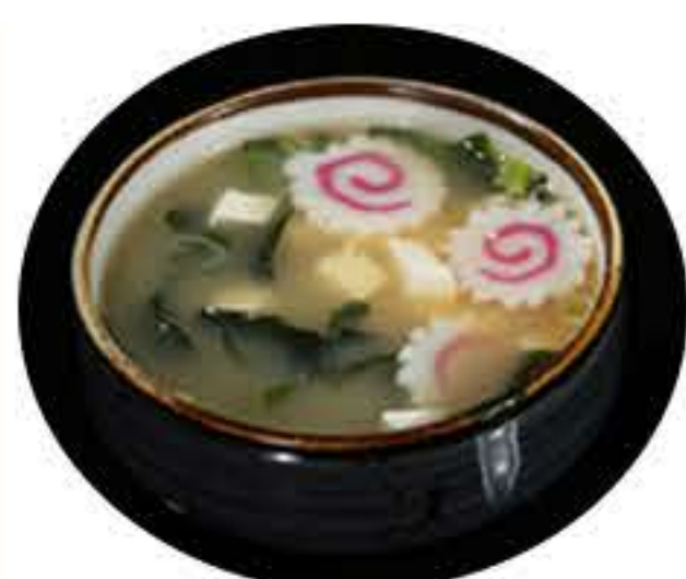
1. Sopa de miso 3,10€