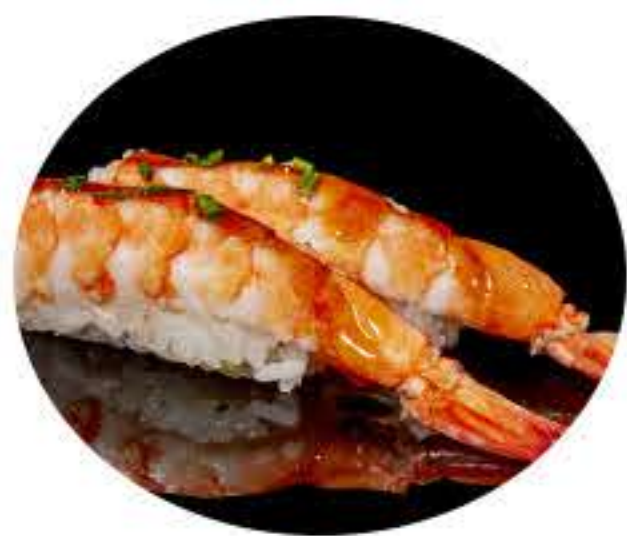
141.Gambas (2u) Nigiri gambas y salsa teriyaki 4,95€