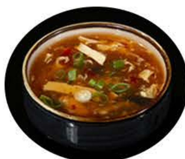
2. Sopa agripicante 3,75€