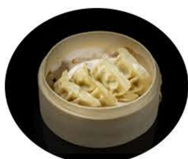
15. Gyoza de pollo (5u) 5,50€