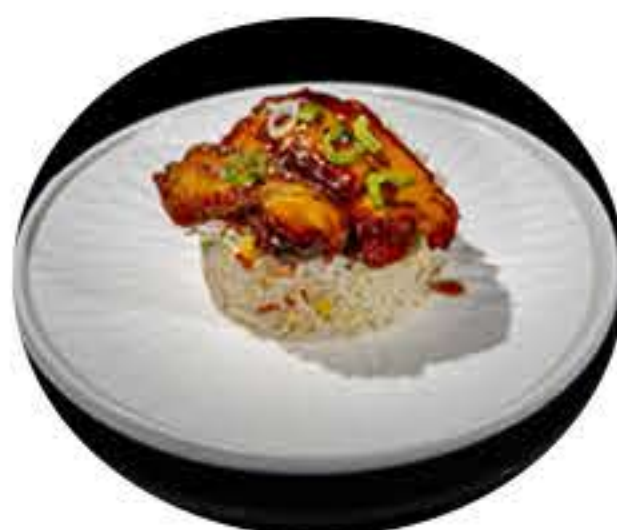
22. Arroz con pollo teriyaki 7,00€