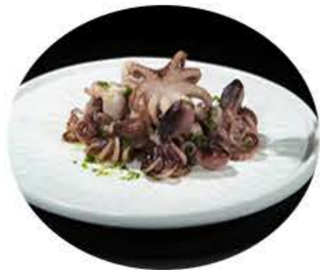
60. Pulпитos a la plancha 7,50€