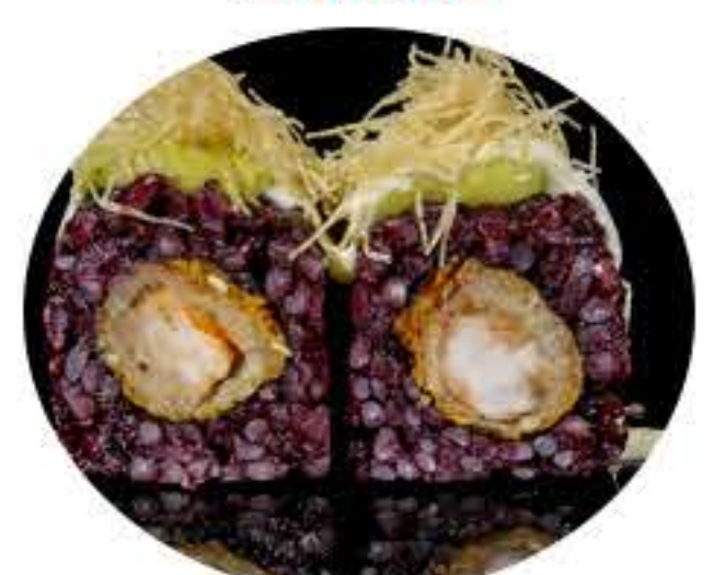
126.Black angel roll (8u) Ura tempura de langostino,kataifi, mayonesa especial y salsa aguacate 9,95€