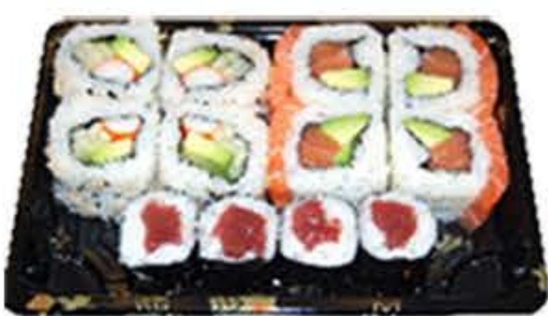
Bento 6 (12u.) 10,50€