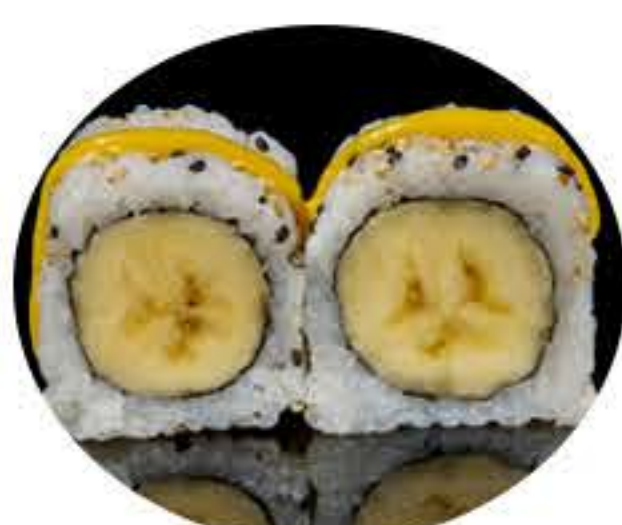
125.Banana (8u) Ura platano y salsa de mango 5,95€