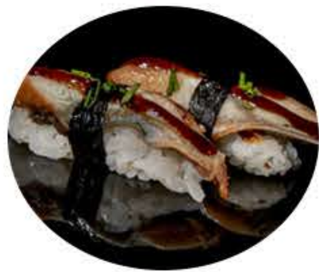
139.Anguila (2u) Nigiri anguila 5,50€