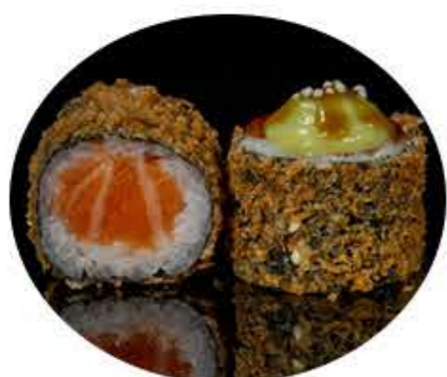
104. Maki de tempura aguacate (8u) Tempura de salmón, Azuma arroz, salsa de aguacate i salsa teriyaki 6,95€