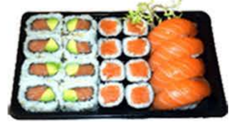
Bento 2 (20u.) 17,00€