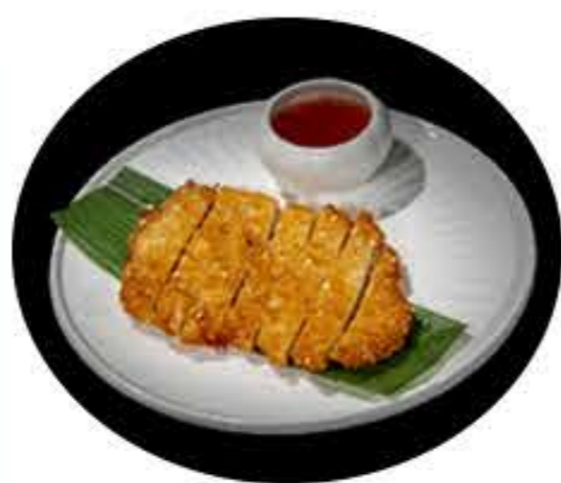
31.Pollo en kimono 5,50€