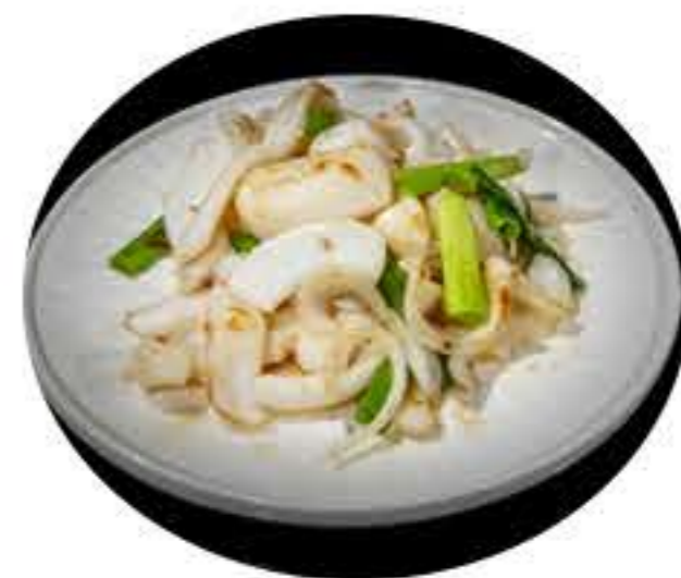
58. Sepia a la plancha 8,50€