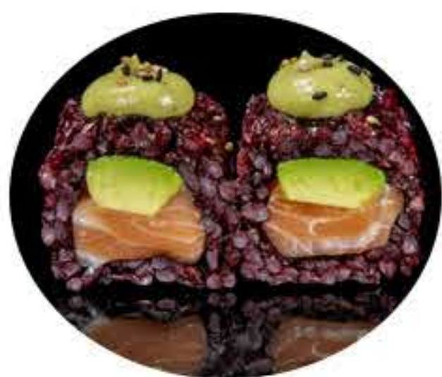
127.Ura california(8u) Ura salmón, aguacate y salsa aguacate 9,95€