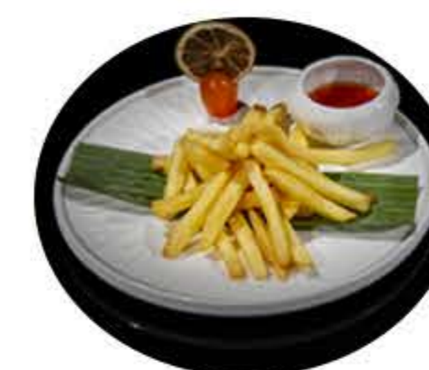
36.Patatas fritas 3,95€