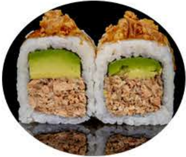
111.Salmón BBQ (8u) Ura salmón frito, aguacate,cebolla crujiente y salsa teriyaki 8,95€