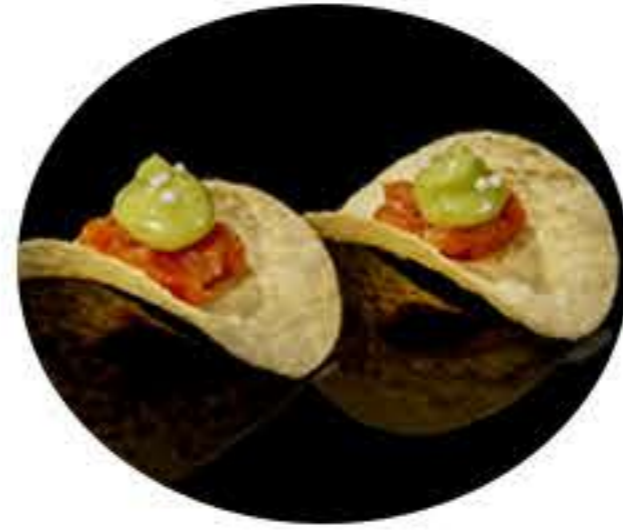
155. Chips (2u) Chips patata, salmón picante, Azuma arroz y salsa aguacate 4,95€