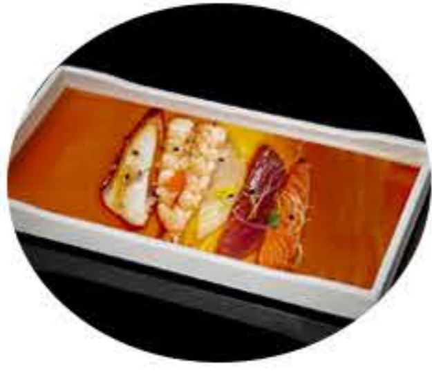
148. Carpaccio mixto Carpaccio mixto, salmón, atun, lubina gamba, pulpo y salsa ponzu 9,95€