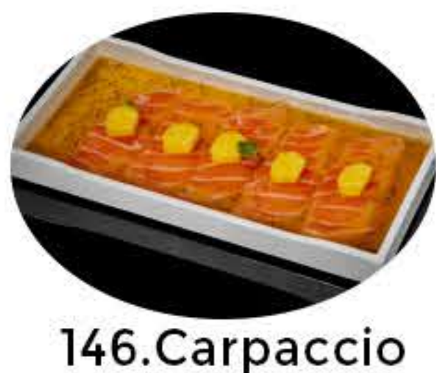
146.Carpaccio passion fruit Carpaccio de salmón,mango y salsa de maracuyá 9,95€