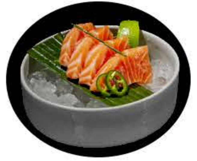
150. Sashimi salmón Sashimi salmón 11,50€