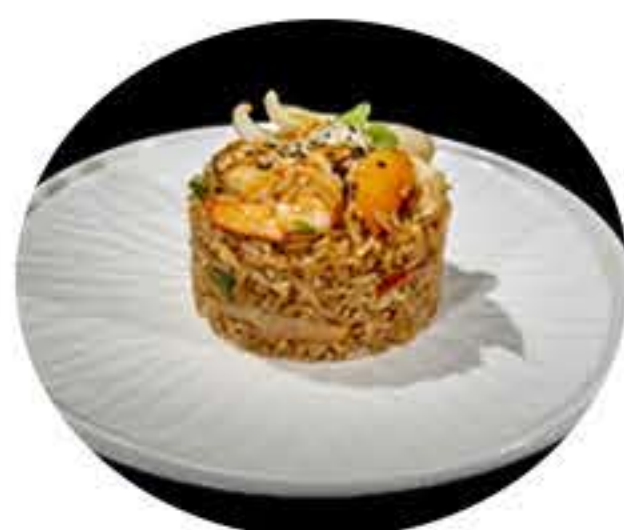
25. Arroz con marisco 8,00€