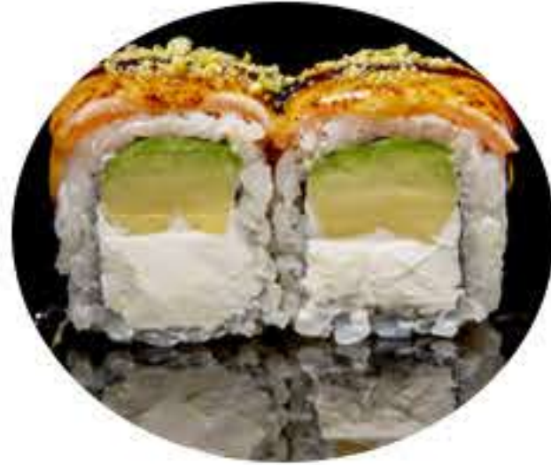
113.King roll (8u) Ura philadelphia, aguacate,salmón flameado,pistacho y salsa anguila 9,50€