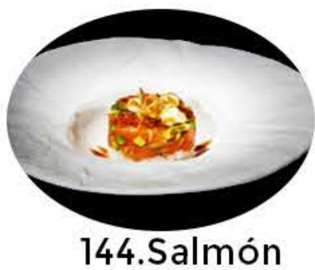
144.Salmón Tartar salmón,aguacate, almendra,mayonesa japonesa y salsa teriyaki 10,95€