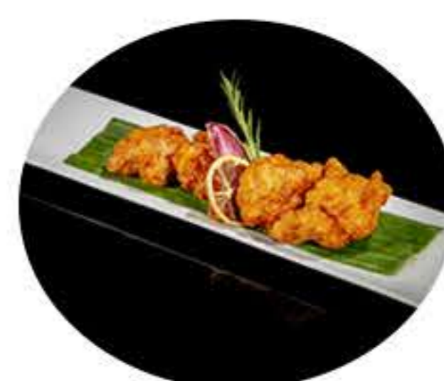
48.Pollo estilo japonés 6,50€