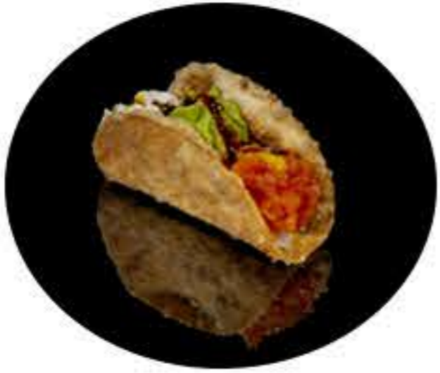
154. Taco (2u) Taco hoja de pasta, salmón picante, philadelphia, aguacate, pistacho, salsa anguila y salsa de mango 6,95€