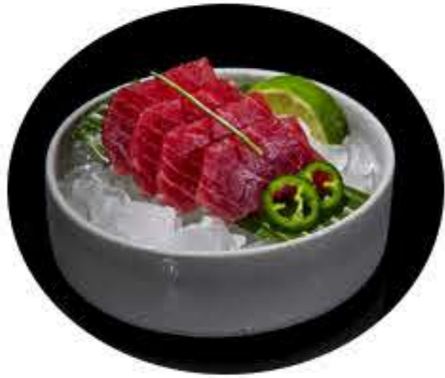
151. Sashimi atún Sashimi atún 12,50€