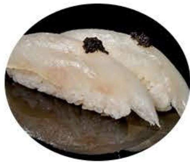
140.Lubina (2u) Nigiri de lubina y trufa 5,50€