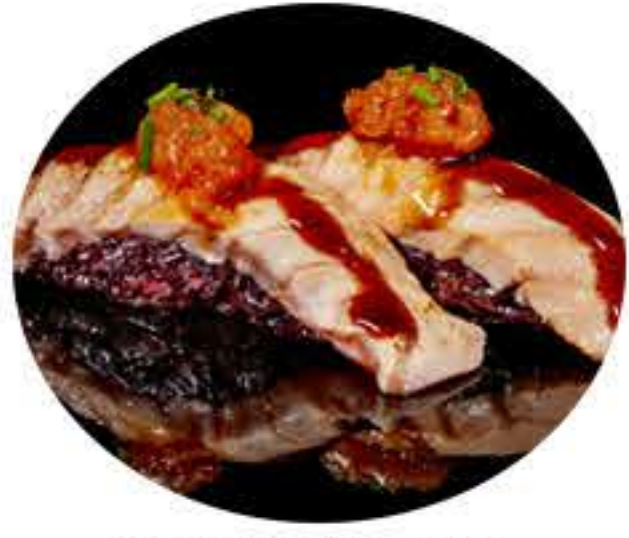
142.Salmón picante (2u) Nigiri arroz negro, salmón flameado, salmón picante y salsa anguila 5,50€