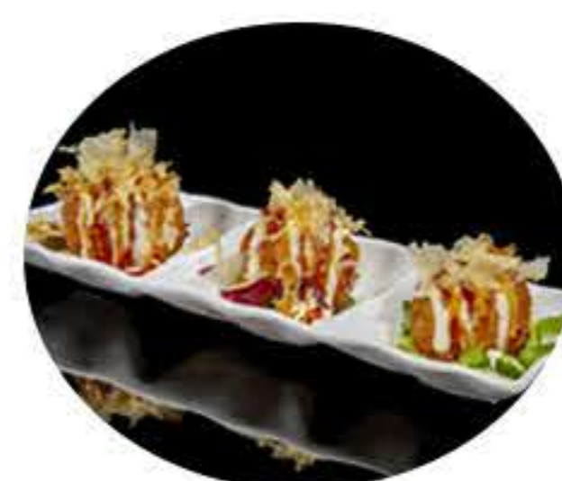
37.Takoyaki de pulpo (5u) 6,95€