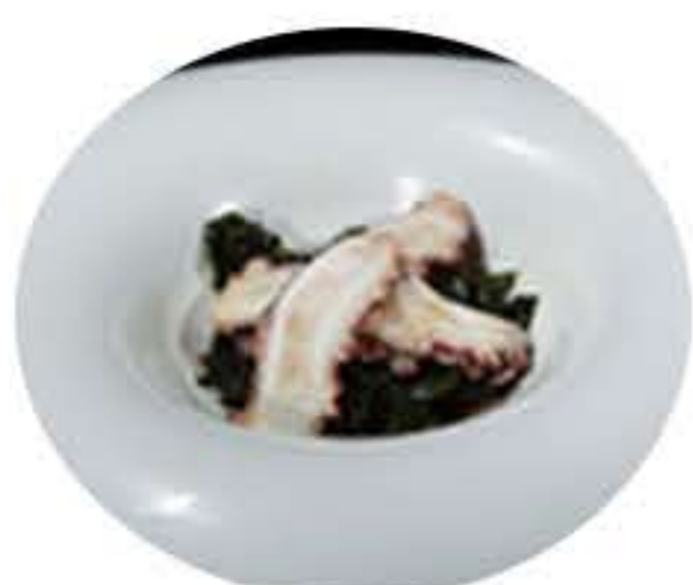
7. Ensalada de algas con pulpo 7,50€