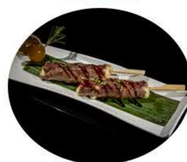
54.Pincho de ternera y queso (3u) 7,00€