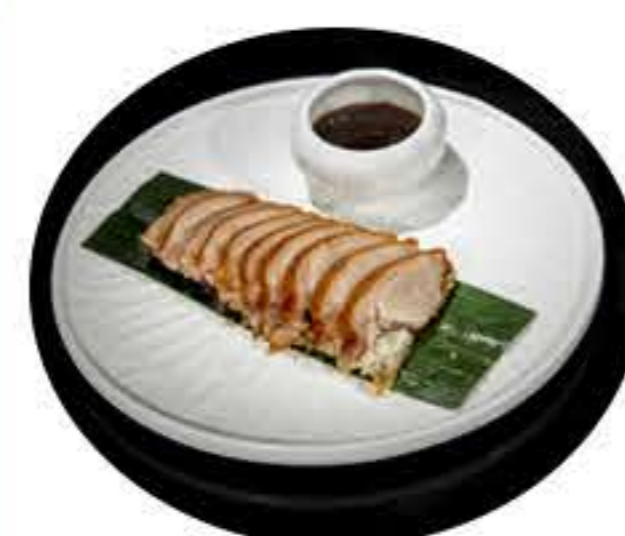
46.Pato laqueado 8,95€