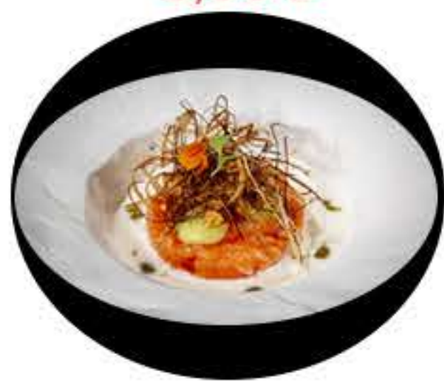
143.White Tartar salmón, aguacate,puerro crujiente,salsa blanca y aceite verde 10,95€