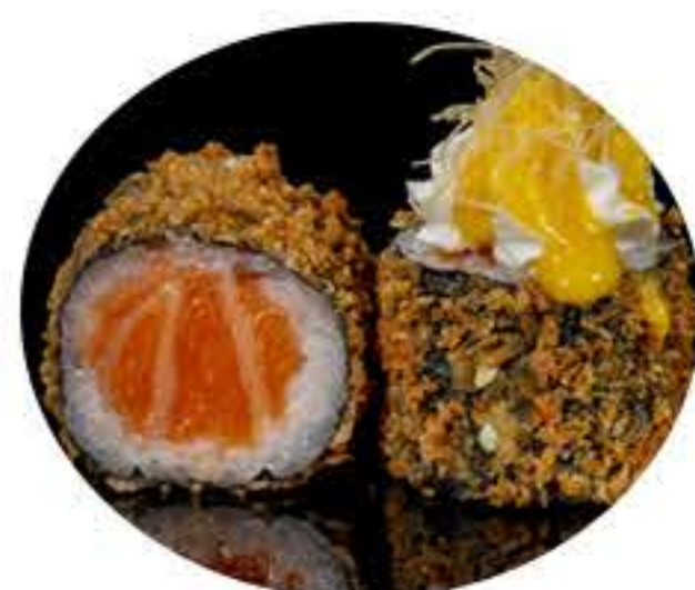
103. Maki de tempura (8u) Tempura de salmón, philadelphia, kataifi y salsa de mango 6,95€