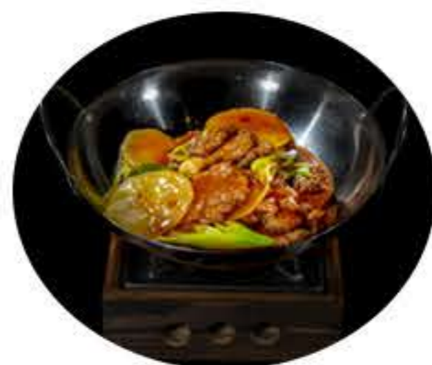
77. Sartén de ternera 7,95€