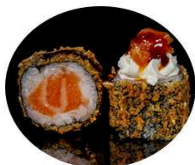
105. Maki de (8u) tempura picante Tempura de salmón, philadelphia, salmón picante, pistacho y salsa anguila 6,95€