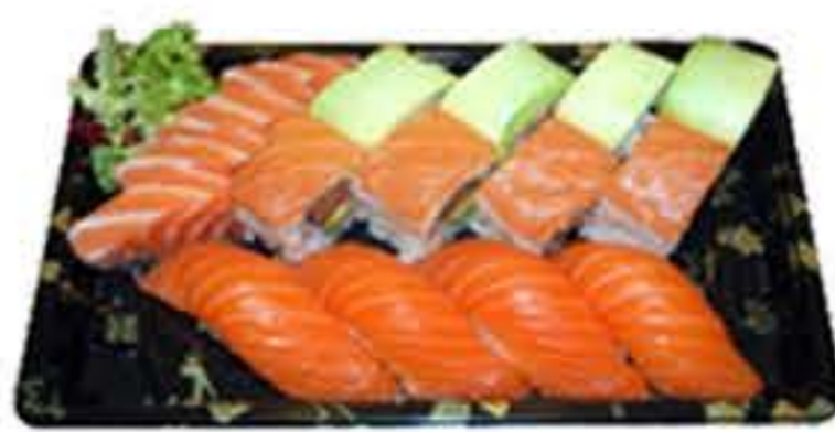
Bento 1 (16u.) 18,70€