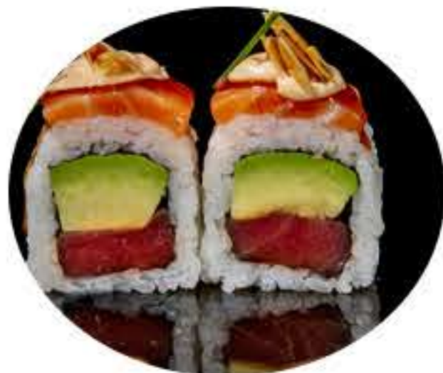
116.Atún picante (8u) Ura atun,aguacate, salmón,almendra, salsa,teriyaki y mayonesa picante 10,50€