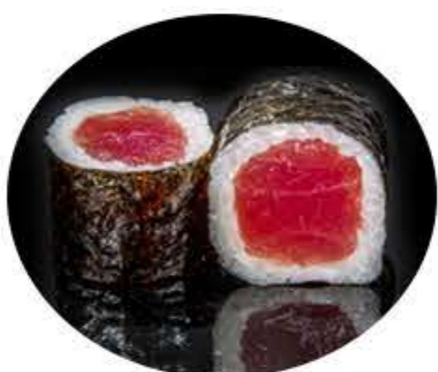
102. Maki de atún (8u) 6,50€