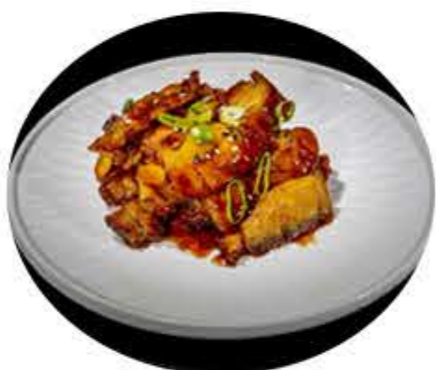
76. Pollo con teriyaki 7,50€