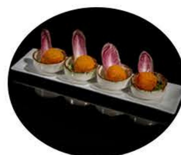
35.Croqueta de setas y trufa (5u) 5,00€