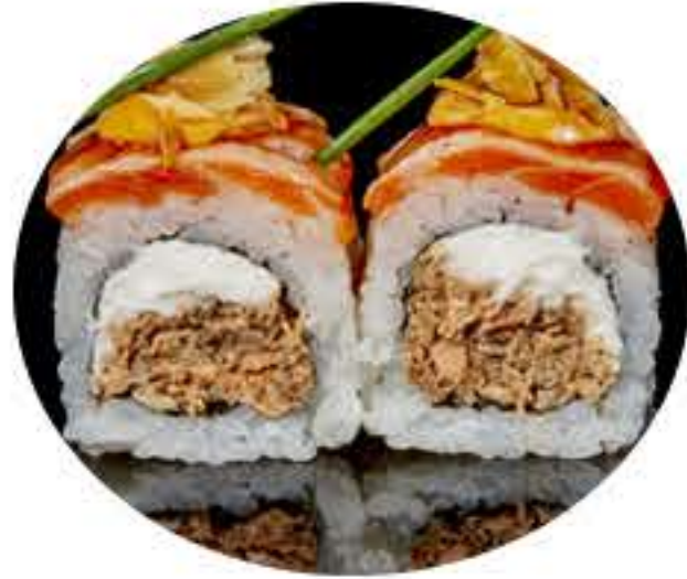
112.América roll (8u) Ura salmón frito, philadelphia, salmón flameado, almendra,salsa teriyaki y mayonesa picante 9,50€