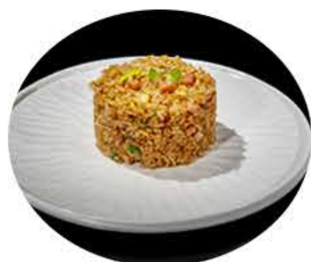
24. Arroz 5 sabores 7,00€