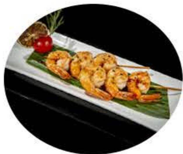
55. Pincho de gamba (3u) 7,00€