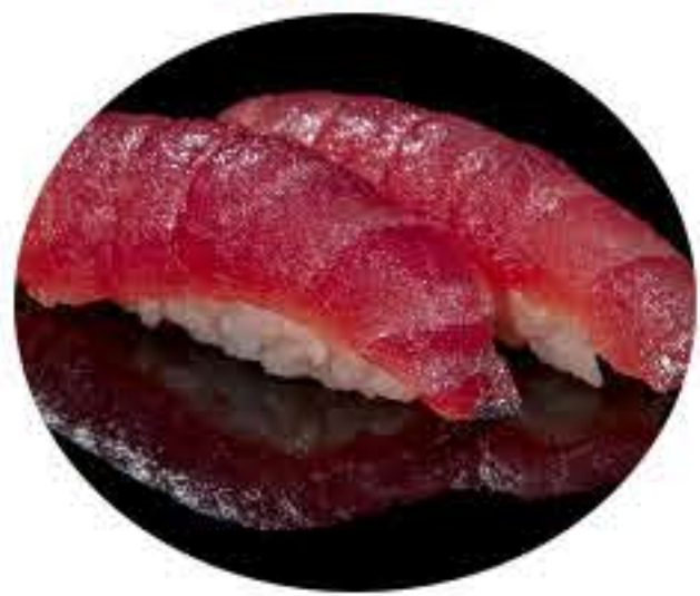
138.Atún (2u) Nigiri atún 5,50€