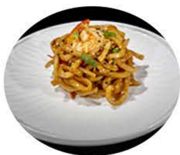
28.Udon con gambas 7,95€