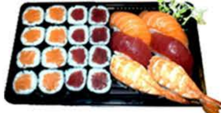
Bento 4 (22u.) 18,50€