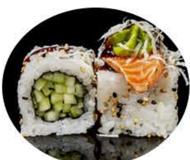
123.Pepino salmón (8u) Ura pepino,aguacate salmón flameado queso parmesano rallado y salsa anguila 9,95€