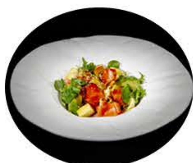
8. Ensalada de salmón 8,50€