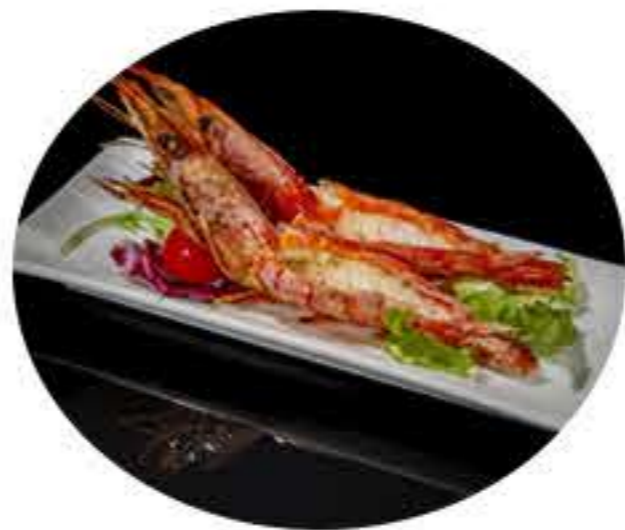
61. Langostinos a la plancha (4u) 8,50€