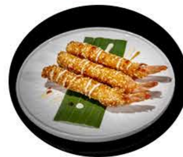
43.Tempura de langostino (4u) 7,50€