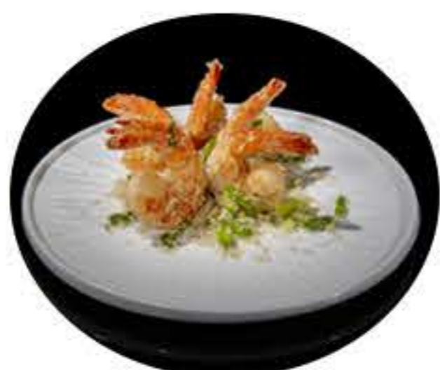
71. Gambas con sal y pimienta 8,00€