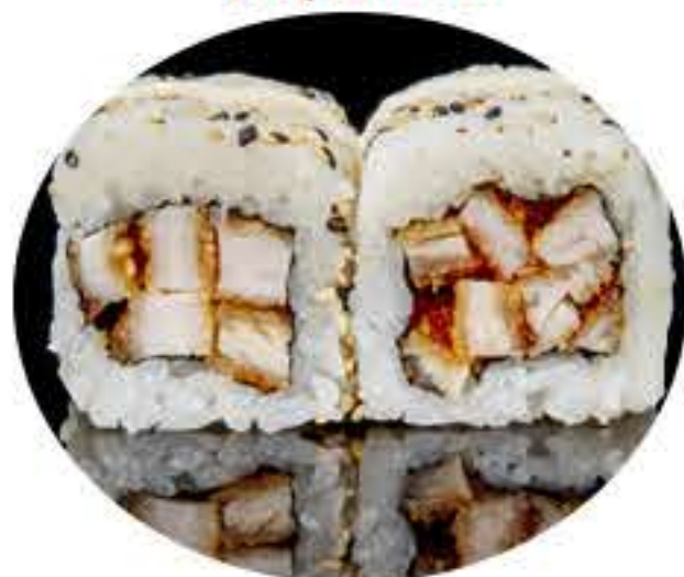
120.Chicken roll (8u) Ura pollo frito y mayonesa especial 7,95€