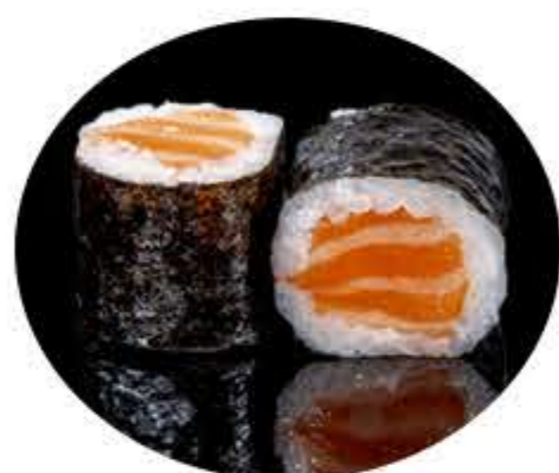
101. Maki de salmón (8u) 6,00€