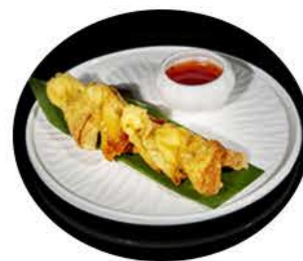
33.Wan tun frito (5u) (cangrejo y queso) 4,50€