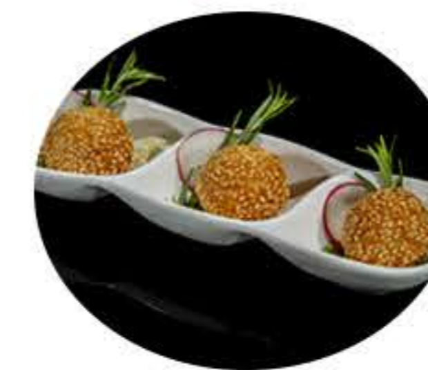
44.Bolas de sésamo (5u) 5,50€