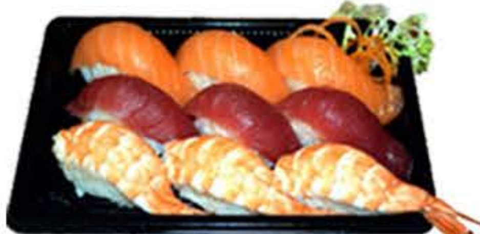
Bento 7 (9u.) 14,00€