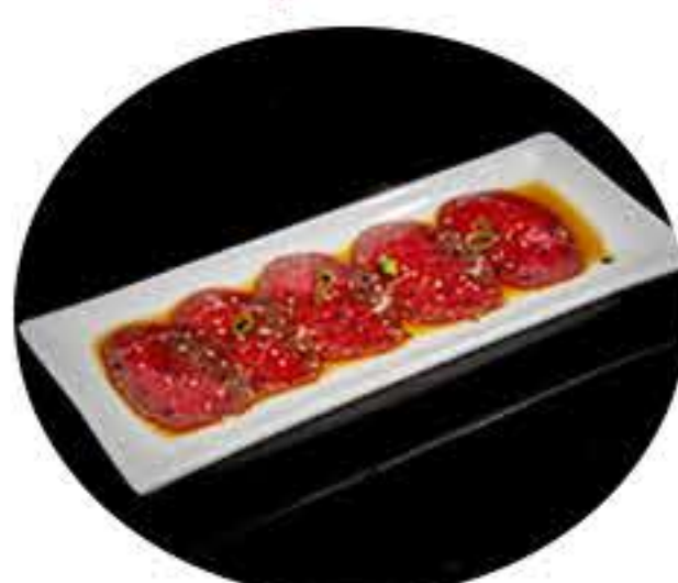
10. Carpaccio de ternera 6,50€