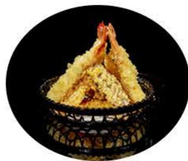
42.Tempura de verduras y langostinos 8,00€