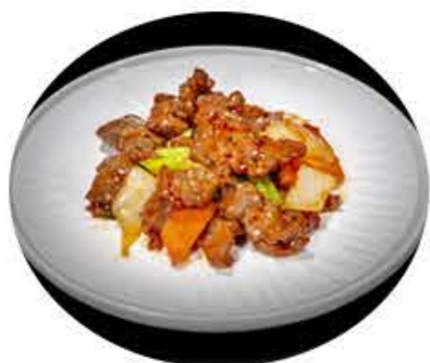
74. Ternera en salsa picante 7,95€