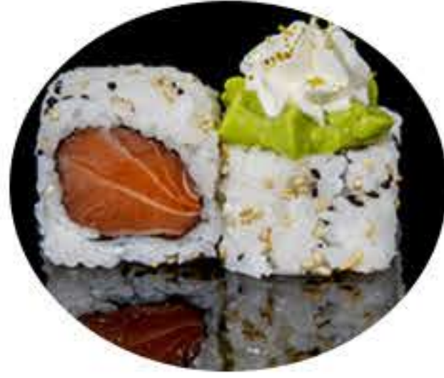
109.Salmón philadelphia (8u) Ura salmón, aguacate, philadelphia, pistacho 8,50€