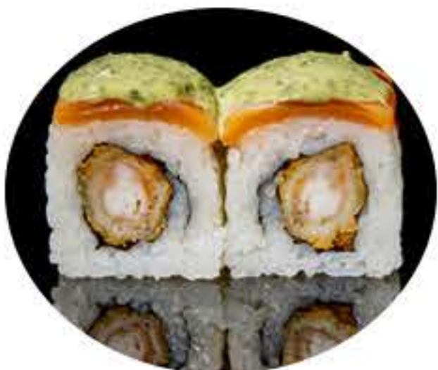
119.Tigre roll (8u) Ura tempura de langostino,salmón, mayonesa,salsa anguila y salsa rucula 9,95€